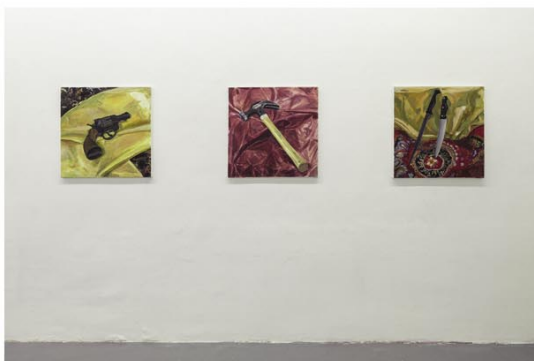
MH_Beautiful Ugly _1.jpg