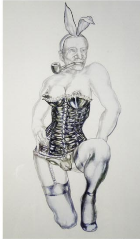
MH_ Bunny boy.JPG