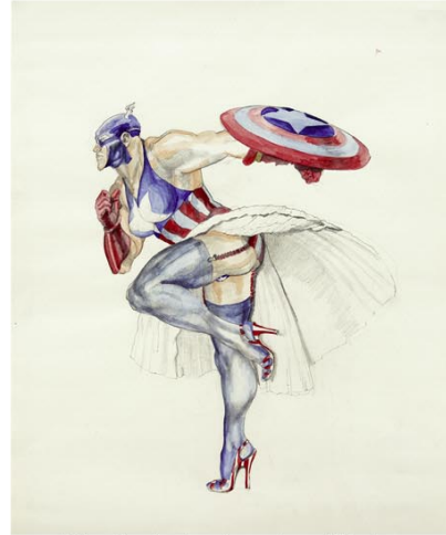
MH_ Captain America II.jpg