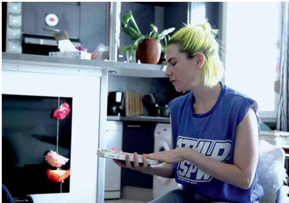
Alex Martinis Roe, Our Feminist Forcebeats , extrait du film de «Claire Finch's contribution», 2018