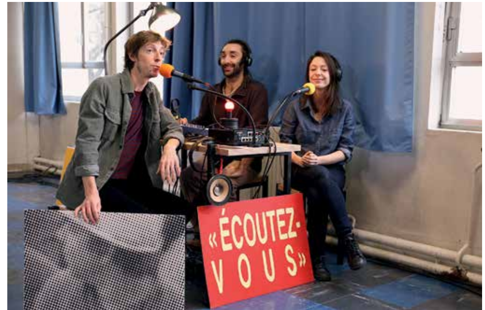
Longueur d'ondes, histoire d'une radio libre

Suppression des cours magistraux, des limites d'âge, ouverture aux non diplômés, création de cours du soir, d'une crèche... Mai 68 est passé par là et pendant 12 ans, l'université de Vincennes vit, dérange, attire les esprits brillants tels que H. Cixous, G. Deleuze, M. Foucault. « La forêt pensante » devient alors un lieu de référence mélangeant militantisme et apprentissage avant d'être fermée, puis effacée du paysage en 3 jours.