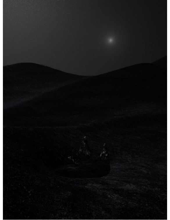
4 Nicolas Pirus