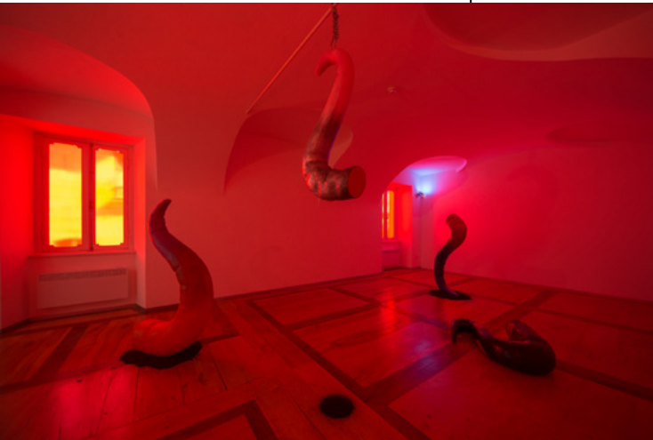
Tarek Lakhrissi This Doesn't Belong to Me , 2020, Vue d'installation, Palazzo Re Raudebengo, Guarene (IT)