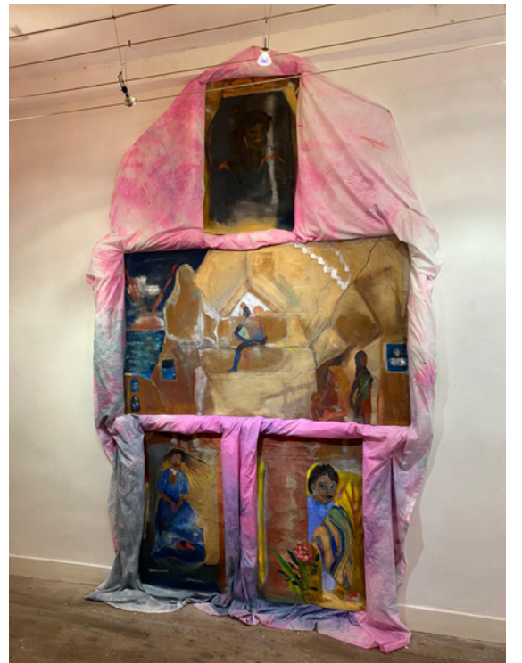
5 Inès Di Folco