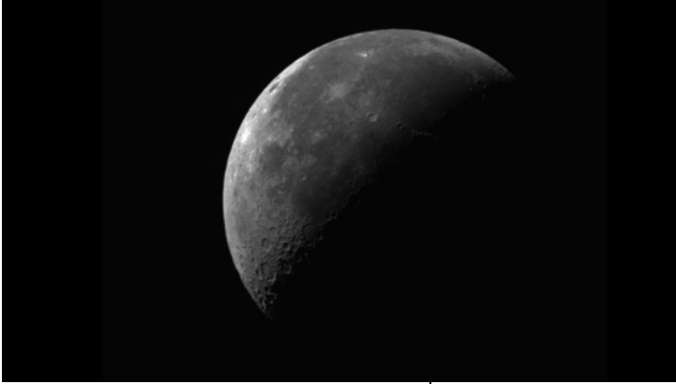
6 Tabita Rezaire