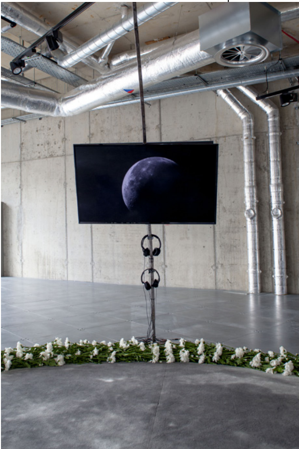
7 Tabita Rezaire