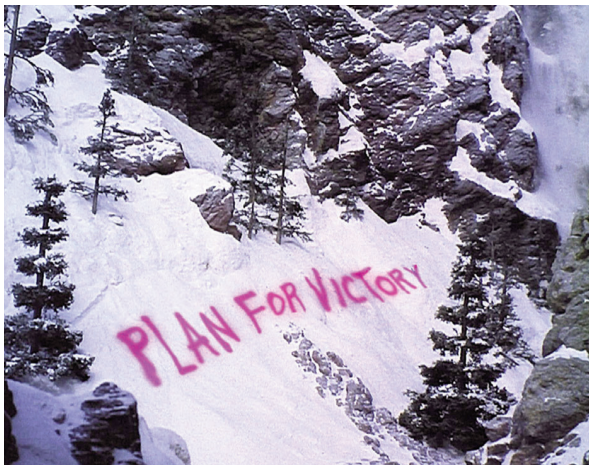
5- Elodie Pong