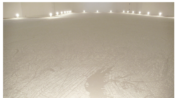
6- Nipan Oranniwesna