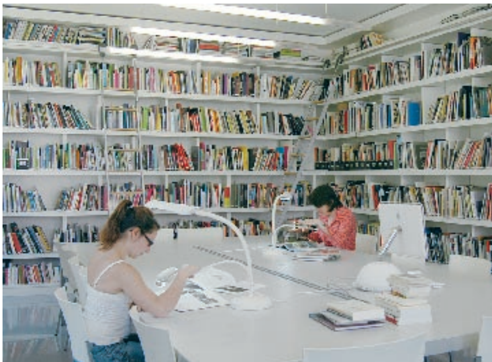
↗ Vue du centre de documentation.