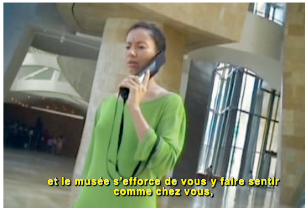
↗ Andrea Fraser, Little Frank and His Carp , 2001. Vidéo, couleur, sonore. Collection Frac Lorraine.

Grâce à la boucle à induction installée dans la salle de conférence, les personnes malentendantes utilisant un appareil de correction auditive réglable sur la position « T » peuvent suivre confortablement les manifestations proposées dans cet espace (projections, conférences etc.).