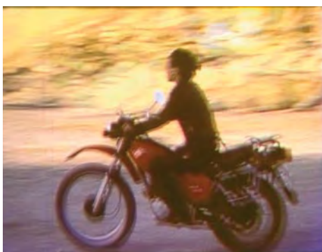
*3 H. Steyerl

Cette exposition dévoile finalement la circulation d'une sélection d'œuvres, leurs trajectoires et la pluralité des regards qu'elles révèlent. Par le biais d'extraits de communiqués de presse ou de catalogues, textes pour le visiteur ou cartels, ces multiples approches (cf page 3), rassemblées dans les espaces du Frac, soulignent la diversité des rapports à l'art et le processus de réécriture de leur histoire qu'occasionne chaque présentation. En effet, chacune d'entre elle est l'occasion, pour les lieux qui les accueillent, de porter sur ces présences voyageuses un regard nouveau. Accumulés au fil des ans, ces textes ont été formulés en allemand, anglais, slovène, grec, français, japonais ou roumain. Incompréhensibles pour certain.e.s, ils évoquent un ailleurs peu connu, suggèrent des sensibilités ignorées et des savoir teintés d'expériences que nous n'avons pas faites.